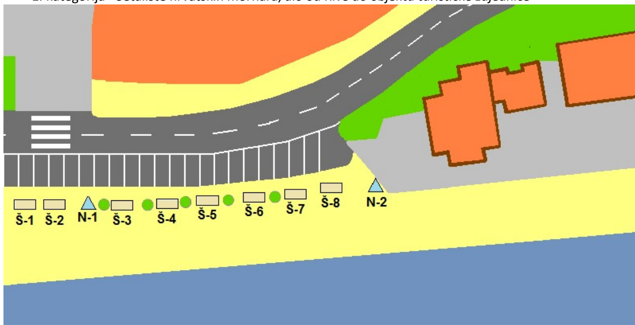
Šetalište hrvatskih mornara I. dio