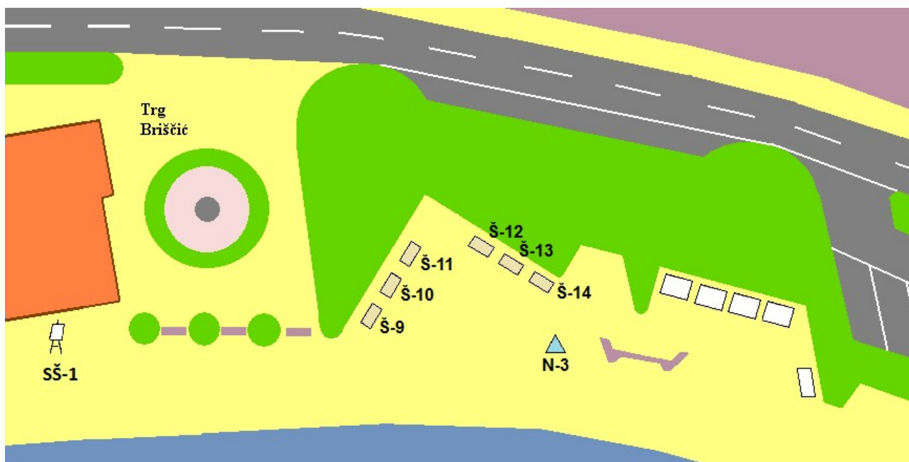
Šetalište hrvatskih mornara II. dio