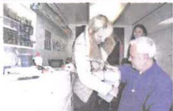
Zainteresirani Zadranjci jučer su ispred Trgovačkog centra mogli napraviti mlični kontrolni pregled

Dan posvećen osobama s Down sindromom prvi je put obilježen u Singapuru 2006. godine, od kada su se mnoge organizacije i udruge diljem svijeta, pa tako i Hrvatskoj, kroz razne događaje i aktivnosti pridružila obilježavanju ovog dana kako bi osobe s Down sindromom u svemu postale ravnopravnim članovima društva.