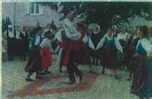
Posebno je bilo lijepo gledati kako veselih gostiju iz Zemunika

Domaćini su bili oduševljeni i dragim su gostima