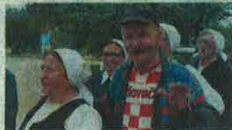
Korisnici su se pridružili folkloralima

Kod nas su svi dobrodošli. Naši korisnici se vesele svakom novom gostu,